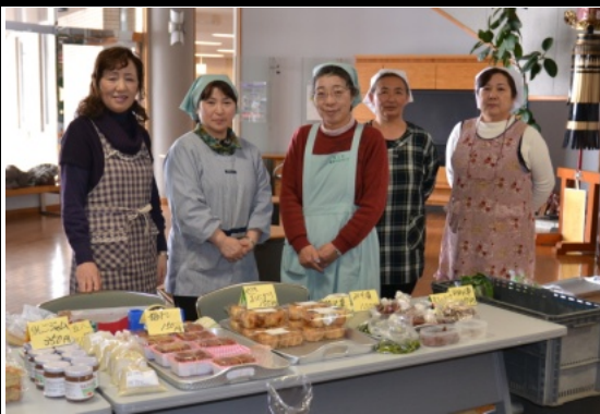
多くのお客様をお待ちしています

毎年12月から3月にかけて、月1回、平川市役所尾上庁舎入口で行われる「ふるさと味のフェア」。開始時間前には行列が出る程の人気で、会員の皆さんが生産した野菜や、それを使った加工品等を販売しています。