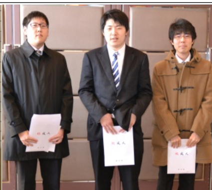
何事にもチャレンジ