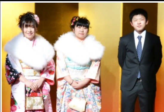
大人の自覚をもって

1月11日、平川市文化センターで行われた成人式には、対象者334人のうち市外在住者を含め215人が集まりました。久しぶりに会う級友たちも多く、式の前には再会を喜び合う姿があちこちで見られました。