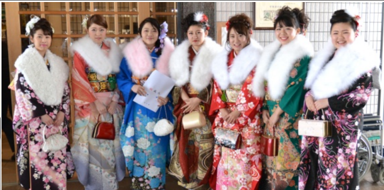
晴れ着に身をつつみ