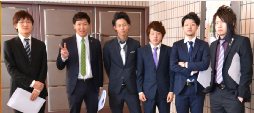
なつかしい友との再会