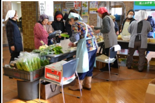
人気商品はすぐに完売です

毎年大好評のふるさとの味フェアが、今年も平川市生涯学習センターで開催され、尾上農産加工グループのみなさんによる手作りの野菜や漬物、焼きそば等が販売されました。10時半の開始時間には、この日を楽しまにしていたみなさんがたくさん集まり、それぞれ目の当の品を買い求めていました。