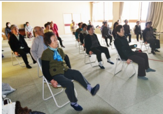
転ばないように筋力アップ

尾上在宅介護支援センターでは、運動器の機能向上を目的として、高齢者向けの転倒予防体操