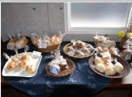
オリジナルベーグル、米粉食パン、クロワッサン、季節のパンなど

だきながら、のんびりおしゃべりできるお店になっています。体に優しく、安心でおいしいパンを作りたいをコンセプトに、自社生産米「つがるロマン」の米粉と国内産小麦、「白神こだま酵母」を使用。卵や添加物なども使っていないパンは、ほんのり甘くモチモチ感は格別です。他にジャムやジュースも販売していますので、みなさんどうぞお立ち寄り下さい。