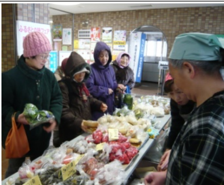
次回のフェアは2月18日です

る手作りの野菜や漬物、焼きそば等が販売されました。10時半の開始時間には、この日を楽しみにしていたみなさんが大勢集まり、それぞれ目当の品を買い求めていました。