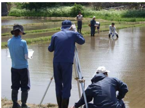
測量チームの準備作業

全国的に有名となった田んぼアート(田舎館)。今年で十五回目となり更にすばらしいデザインが求められるなかで、今回は富嶽三十六景から、代表的な二作品が選ばれました。今までは稲がだいぶ実ってから見