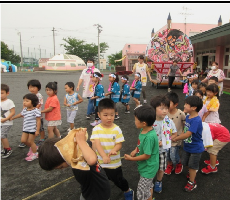
ねぶた運行で夏祭りを満喫

の、園児と職員だけが参加し、保護者らは離れた所から見守るまつりとなりました。 3歳以上の60人が「ヤーヤドー」と元気な掛け声を響かせながらねぶたを引っ張り、年長児が練習を重ねてきた太鼓を披露。年下の子どもたちもいっしょに掛け声を上げながら、楽しい夏の思い出に満足していた様子でした。