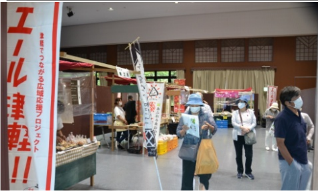
多くの買物客が訪れました

津軽でつながる広域応援プロジェクト「エール津軽」が8月22日・23日、29日・30日にさるか荘で開催されました。これは新型コロナウイルス感染症の影響により、打撃を受けている地域経済を応