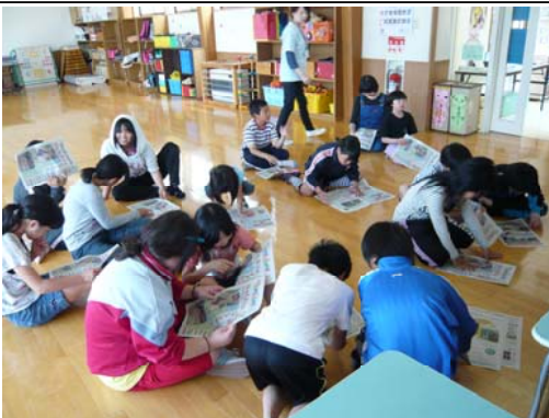
新聞の中に出てくる「徳川家康」をさがします

まず初めに、東奥小中 学生新聞「週刊ジュニジュ ニ」を全員で読み、次は 新聞の中に出てくる言葉 をさがすゲーム、数独に 挑戦、そして最後に、丸 めて作ったボールをころ