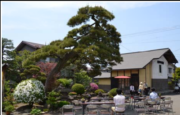
小野さん宅で行われた庭園観賞茶会

は、観光客が多数訪れ、 柏農高生や弘大生のガイ ドと一緒に、個人宅の立 派な庭園を散策しました。