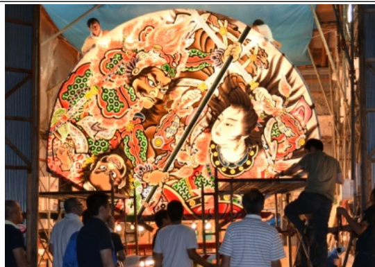
紙張りされた直後の日沼子ども会ねぶた

地区コミュニティ施設では、笛や太鼓の練習も行われていますが、今年には、八幡崎ねぶた同志会からの誘いを受け、平川ねぶたまつりにも子ども達も参加。それに合わせたはやしの練習も行ったそうです。